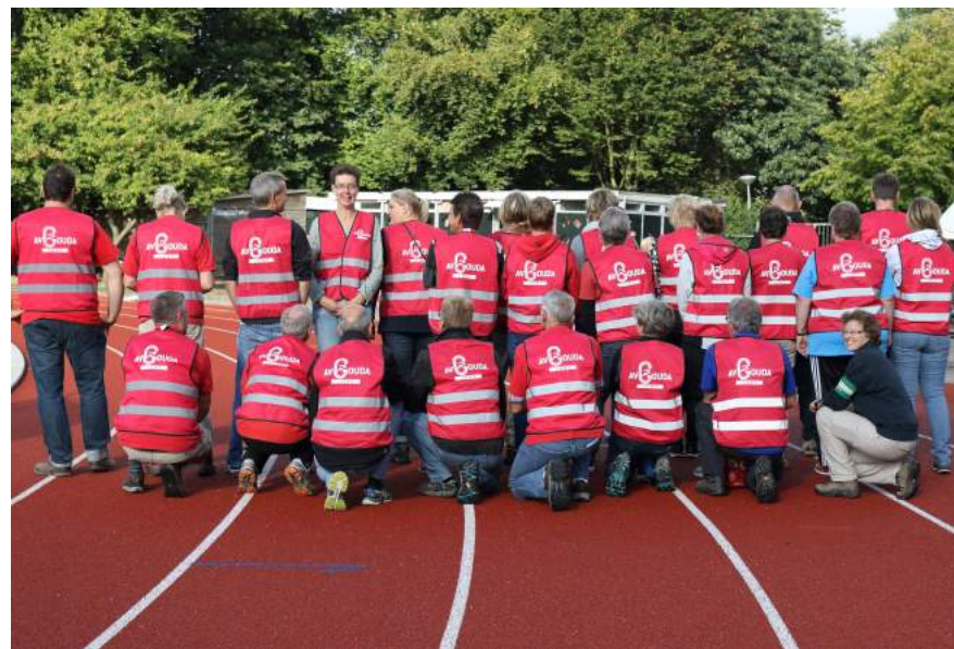
Nieuwe hesjes voor alle juryleden