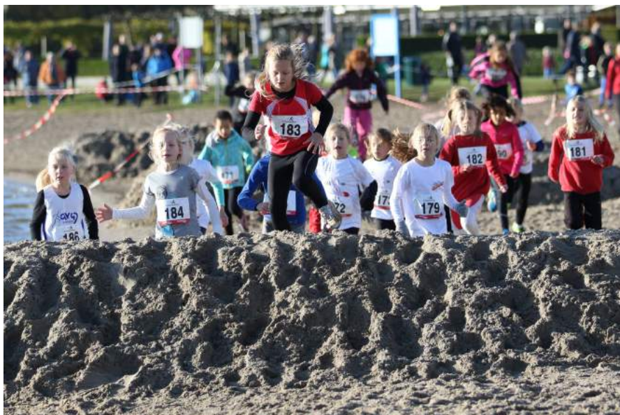
Pupillen in actie tijdens de cross in Reeuwijk

In samenwerking met de Brede School stonden er onder andere 70 basisscholieren aan de start. Een deel van hen had ook deelgenomen aan een voorbereidende clinic (drie weken) die gegeven is door Gonnie Paulides.