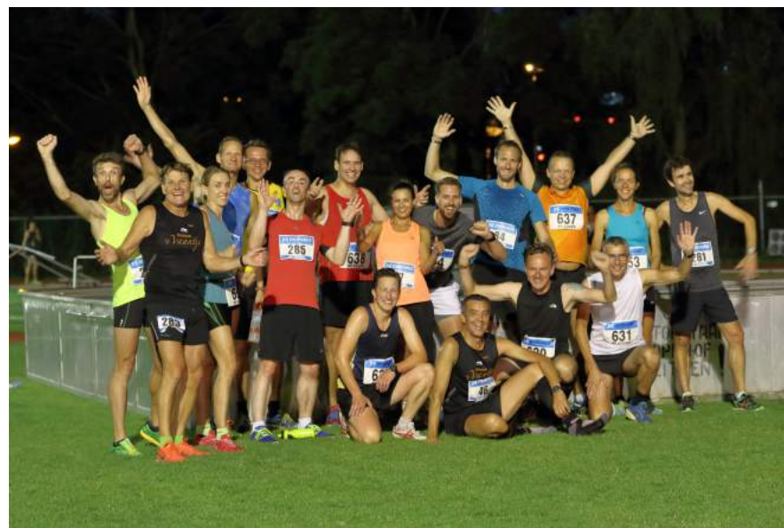
Groep langeafstandslopers doet massaal mee met K&S Instuif

Ten slotte is tijdens de algemene ledenvergadering in november het nieuwe contributiehuis goedgekeurd door de leden. Het nieuwe contributiehuis gaat in per 1 januari 2017. Belangrijke uitgangspunten van het nieuwe contributiehuis zijn dat alle leden een verenigingscontributie betalen van € 50,- per jaar.