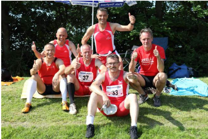
Mastercompetitie, Zevenbergen, 2016